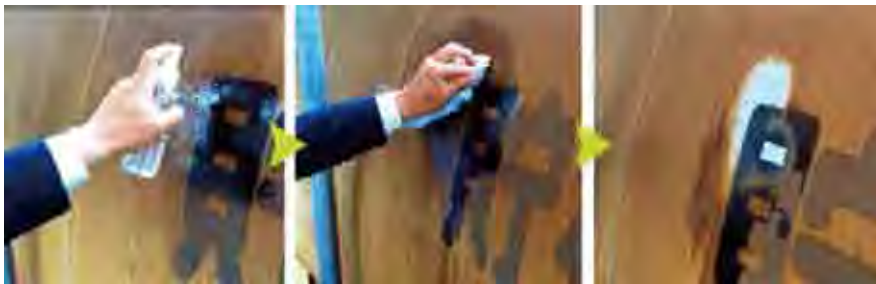
洗浄剤の希釈液をシュッとスプレー、乾いた布で軽くこすります。するとこすった部分だけ、タンクの地肌が……!

湾岸工場地帯にあるJ製鉄所様。油で茶色くなった燃料タンクを綺麗にしたい!とのお話が。そこで実際に、高性能洗浄剤をスプレーし、布でさっとふき取り。するとベトベトの油汚れが……?!この続きは、動画をご覧ください!